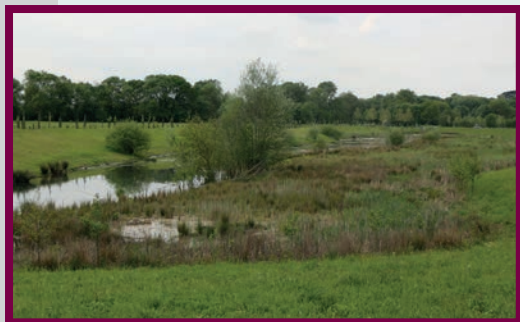
Marais de Palluau

Le milieu naturel définit un espace accueillant différents habitats qui permettent aux espèces végétales et animales de vivre. Un ensemble de caractéristiques (climat, température, exposition, nature du sol...) les définit.