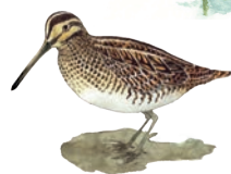
Bécassine des marais