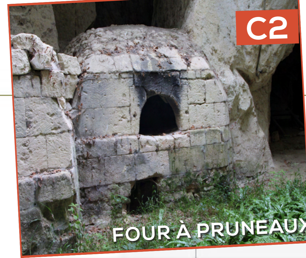
FOUR À PRUNEAUX