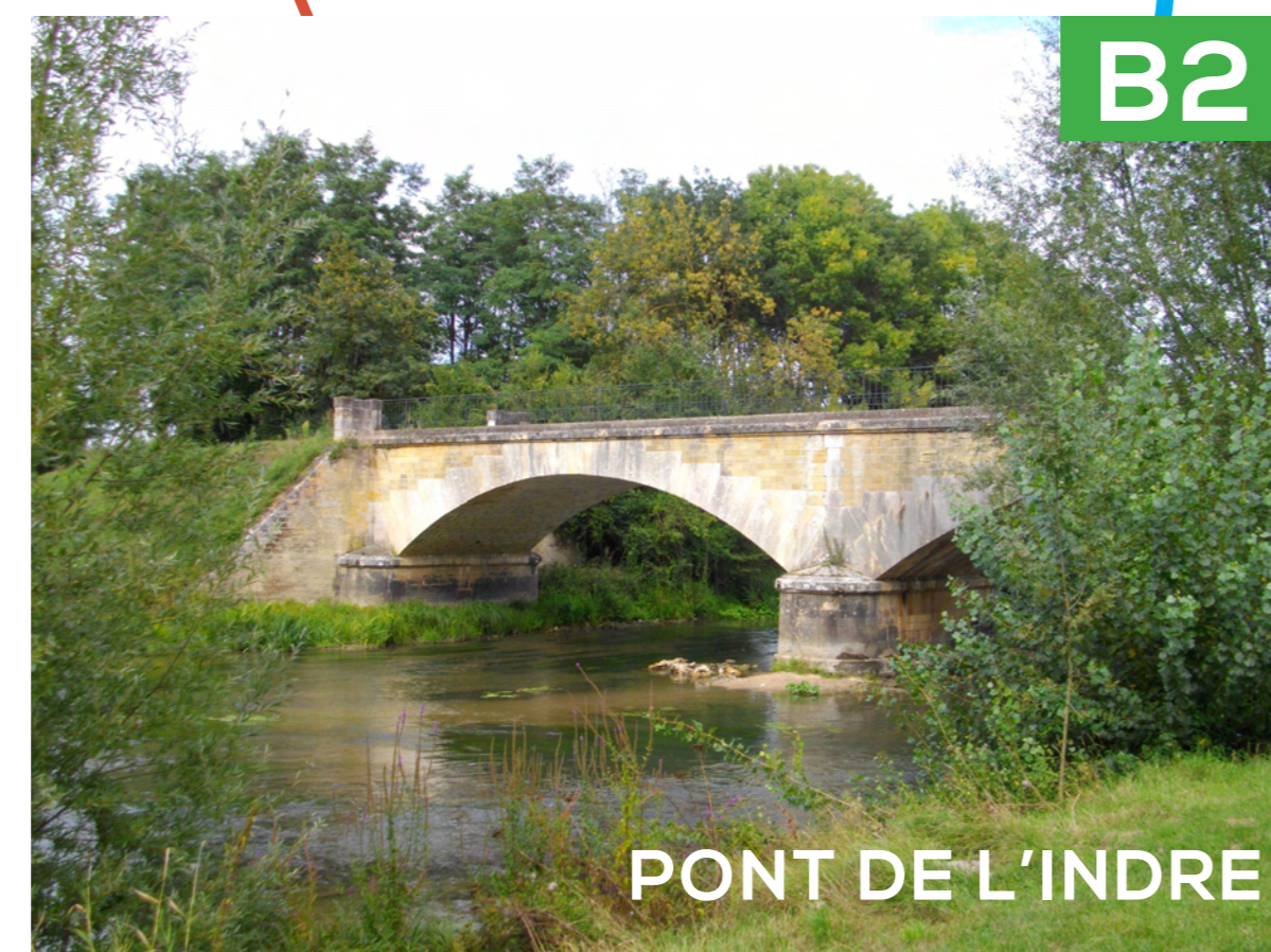
PONT DE L'INDRE