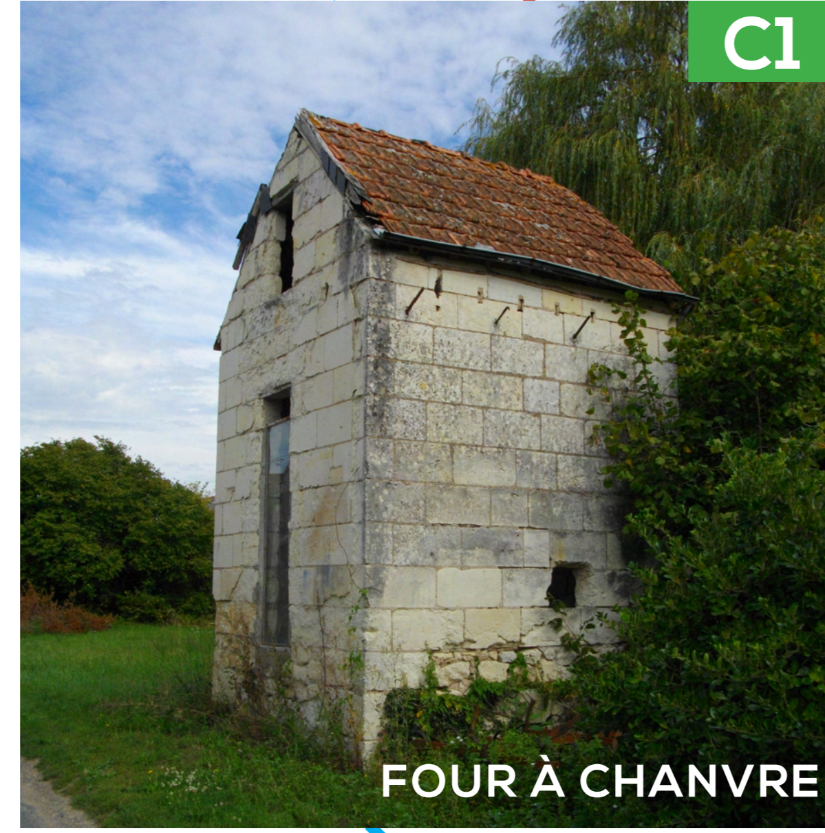
FOUR À CHANVRE

Place de l'église - 37420 Huismes huismes.mairie@wanadoo.fr