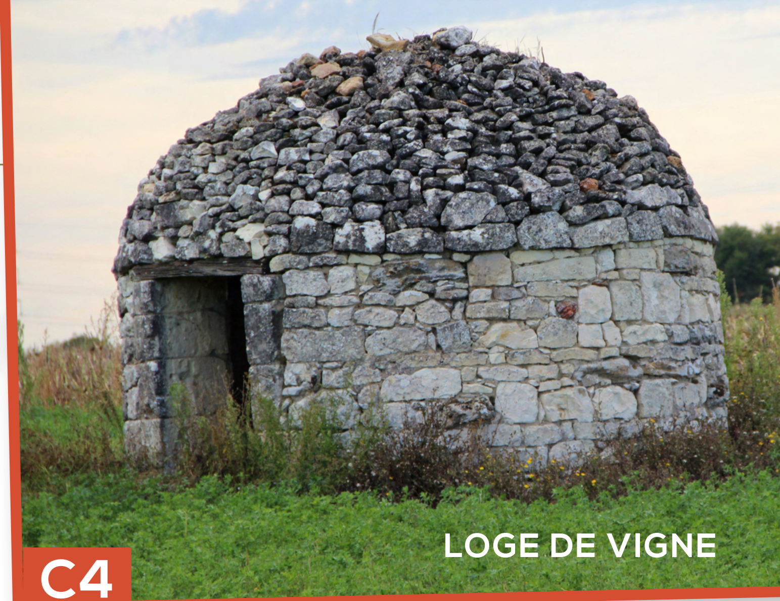
LOGE DE VIGNE