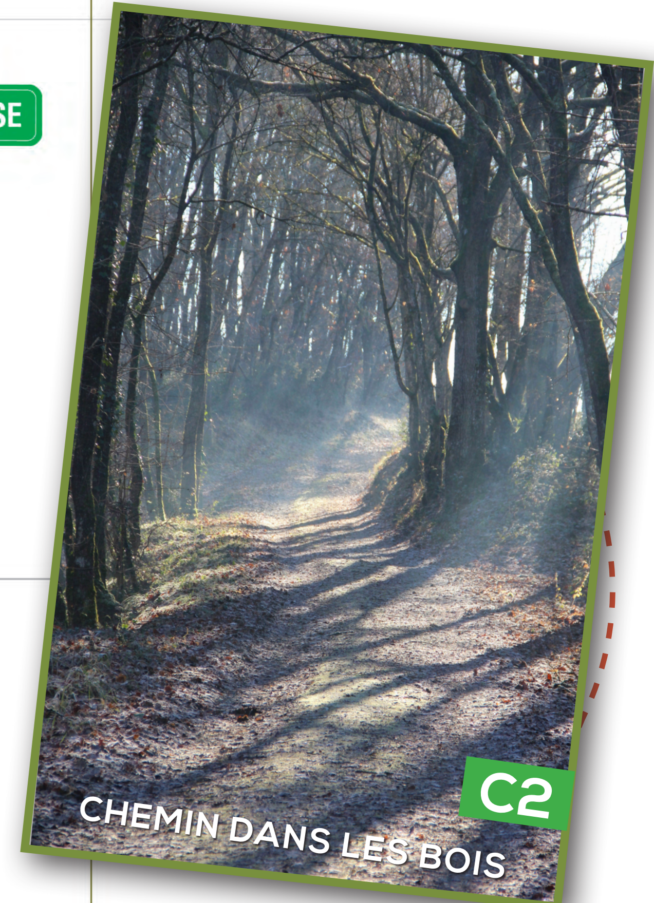
CHEMIN DANS LES BOIS