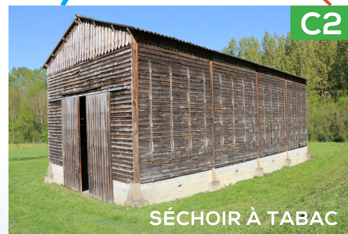
SÉCHOIR À TABAC